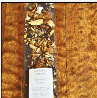
Almendra & Naranja

Coco, aceite de coco, cacao, ashwaganda, agave, cacao butter.