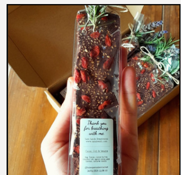
Goji & Sesame

Cacao, cacao butter, aceite de coco, agave.