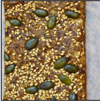
Energy Date Bar Energy Bar Dátil