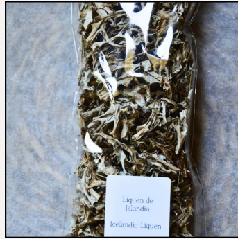
Liquen de Islandia